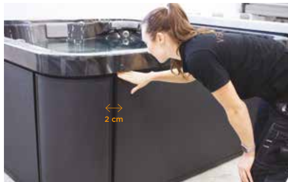
3. Wyreguluj panel w poziomie tak, aby z ka dej jego strony pozostawał odst p ok. 2 cm.