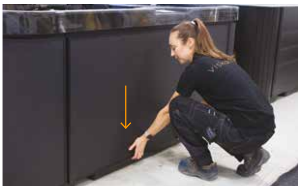
2. Pozwól, by panel opadł na swoje miejsce.