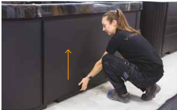
1. Przesu panel do góry, a rowki z tyłu wyjdą z zaczepów, które utrzymują go na miejscu.