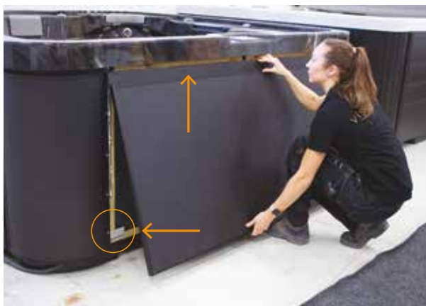
1. Naci nij panel w gór i włó rowki na dolnej kraw dzi panelu w zaczepy znajduj ce si na dolnej kraw dzi ramy wanny.