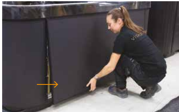
2. Poci gnij panel do siebie i odł cz go od mocowania.